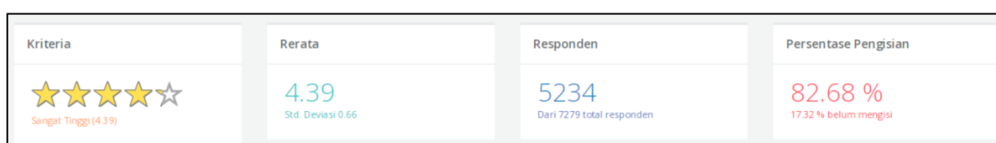
Gambar 2. Ringkasan statistik Hasil Emonev PBM Awal Semester Genap TA 2023/2024

Berikut contoh Hasil Emonev Awal Semester Genap Tahun Ajaran 2023/2024 adalah sebagai berikut: