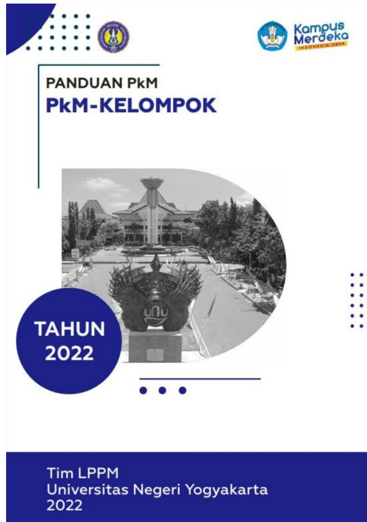
Gambar 1. Panduan PkM Kelompok