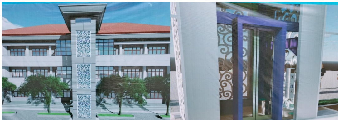
Gambar 4. Elevator Gedung Moh. Yamin

Pekerjaan pemeliharaan gedung lainnya juga dilakukan di sisi timur Gedung Moh. Yamin (PLA) yaitu adanya lift untuk menunjang seluruh kegiatan fakultas (Gambar 4).