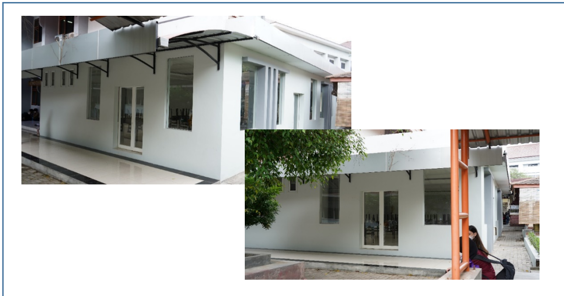
Gambar 3. Fasilitas Kantin Ungu Resto FSB UNY

Untuk menunjang pelaksanaan kegiatan belajar mengajar dan administrasi umum, fakultas juga mengembangkan fasilitas di lingkungan Fakultas Bahasa, Seni, dan Budaya dengan menggunakan prinsip skala prioritas. Pengembangan faslitas yang dilakukan ialah pengembangan pada unit kantin Ungu FSB demi menunjang kenyamanan mahasiswa fakultas saat istirahat.