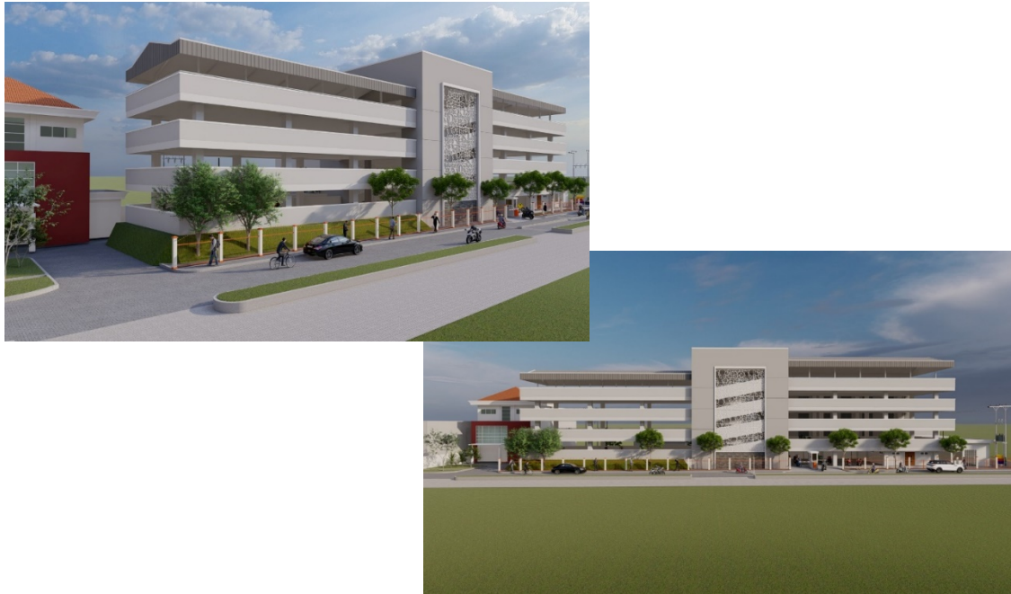
Gambar 5. Rencana Pembangunan Tempat Parkir Terpadu FBSB UNY Tahun 2023–2024

Pada awal tahun 2023 fakultas telah mencanangkan pengembangan fasilitas dengan tujuan menunjang dan mendukung seluruh kegiatan di fakultas. Rencana pengembangan fasilitas di FBSB ialah pembangunan berupa pekerjaan konstruksi tempat parkir terpadu. Pembangunan tersebut yang akan berlokasi di sisi timur Gedung Chairil Anwar FBSB UNY dengan rencana dilakukan secara bertahap (3 tahap). Berikut merupakan rancangan pekerjaan yang akan dilakukan untuk pengembangan fasilitas di FBSB UNY.