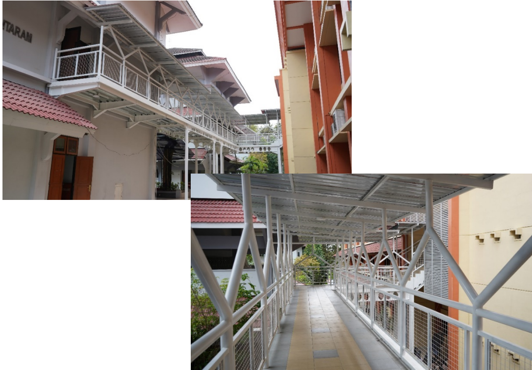
Gambar 3. Foto Doorloop yang menghubungkan lantai 2 Gedung WS Rendra, Gedung Ki Ageng Suryomentaram, dan Gedung R.Ng. Ranggawarsita.

Pekerjaan pemeliharaan gedung lainnya juga dilakukan di sisi timur Gedung Moh. Yamin (PLA) yaitu adanya lift untuk menunjang seluruh kegiatan fakultas (Gambar 4).