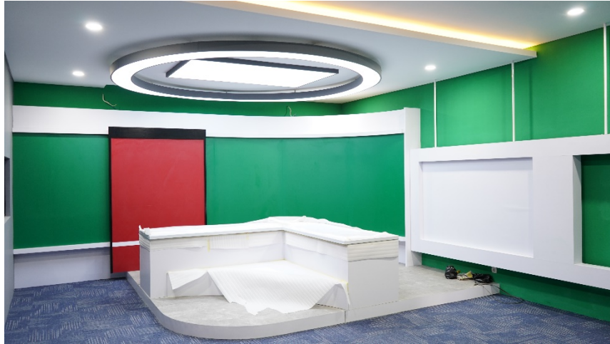
Gambar 2. Ruang Broadcasting Pembelajaran Deskomvis di Lantai 2 Gedung Prof. Dr. (HC) Amri Yahya

Untuk menunjang pelaksanaan kegiatan belajar mengajar dan administrasi umum, fakultas juga mengembangkan fasilitas di lingkungan Fakultas Bahasa, Seni, dan Budaya dengan menggunakan prinsip skala prioritas. Pengembangan faslitas yang dilakukan ialah pengembangan pada unit kantin Ungu FSB demi menunjang kenyamanan mahasiswa fakultas saat istirahat.